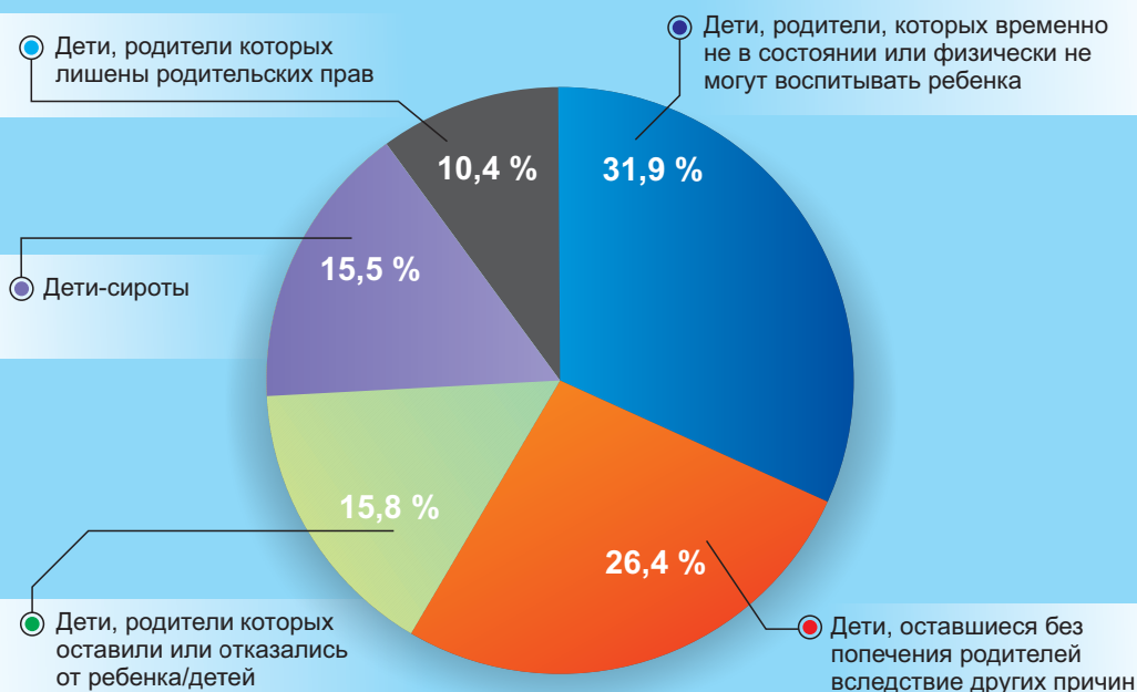
Рис.1 Распределение причин, вследствие которых дети до 18 лет остались без попечения родителей, 2017

Согласно данным Государственного Комитета Республики Узбекистан по статистике в 2017г. 9223 ребенка остались без попечения родителей. Анализ причин, вследствие которых дети остались без попечения родителей, представлен на Рис. 1